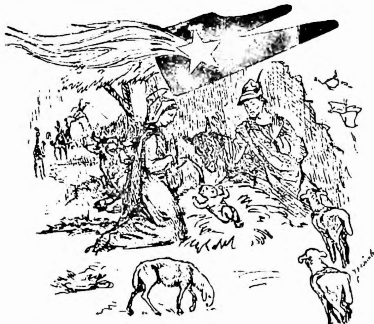
Il Comitato per il Bosco delle Penne Mozze e la Sezione di Vittorio Veneto dell'Associazione Nazionale Alpini porgono alle Autorità, alle Forze Armate, agli Alpini in armi, alle Associazioni combattentistiche e d'Arma, alle Sezioni dell'A.N.A. in Italia e all'estero gli

La cerimonia si è conclusa con il ringraziamento della Madrina la quale ha pure espresso il proprio compiacimento per l'iniziativa che gli Alpini di Cison intendono conseguire per realizzare questa testimonianza — validissima sul piano morale e su quello artistico — del sacrificio delle Penne Mozze